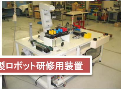
三菱電機製ロボット研修用装置