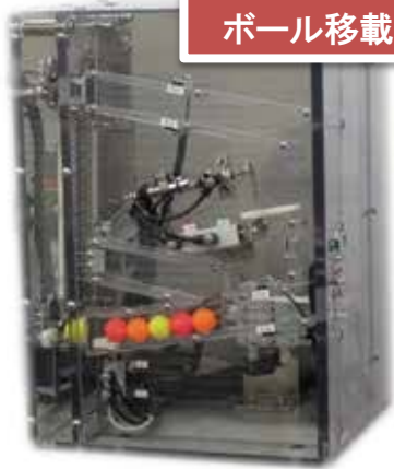
ボール移載実習装置

社内教育・研修に沿ったオリジナルの教材開発のご要求も多く頂いております。最新のロボット技術・駆動制御・トラブルシューティング等、目的に応じた実習装置の製作が可能です。