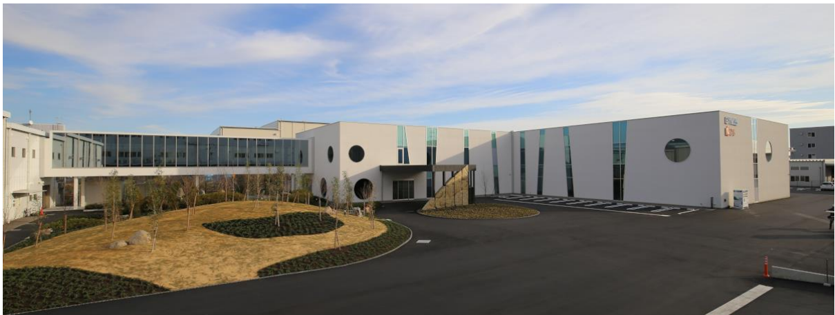
協働ロボットセレクションセンター

各社の協働ロボットのデモンストレーションを主としたロボットセンターとは違い、「実システムで協働ロボットを導入したい」という目的をもったお客さまに、検証・ロボットメーカー比較・評価を行い、協働ロボットに特化した実システムを実現するためのノウハウを提供する今までにないロボットセンターです。